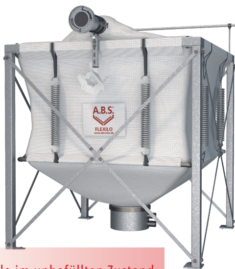
Silo im unbefüllten Zustand

Wenn's mehr sein soll, dann ist das Flexilo® FEDER+ die perfekte Alternative zum Standardsilo. Da sich bei der Befüllung der Silokonus durch das Gewicht der Pellets über die gesamte Silomitte bis zum Boden absenkt, lässt sich fast die komplette Stellfläche als Lagerraum nutzen und der Gewebetank wird auf ein Maximum gefüllt – das bedeutet ein PLUS bis zu 60% bei gleicher Grundfläche. Für die zuverlässige und vollständige Entleerung dieses Hebesilos sorgen Zugfedern. Die Entnahme erfolgt punktuell durch einen Absaugtopf mit integrierter Saugsonde.