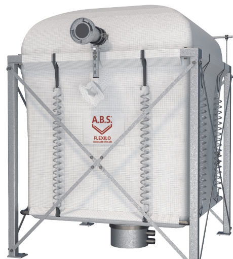
Silo im gefüllten Zustand